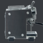
DARK EARTH OAK